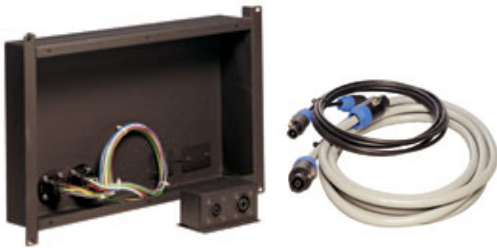
アンプリモートケースと延長ケーブル(各種長さ有り)

スピーカー本体を壁に埋め込むなどで本体のアンプ調整時にリアパネルへのアクセスが困難な場合は、オプションのアンプリモートキットを使用することで、アンプモジュールを外部に取り出してラックマウント型のアンプシャーシにマウントすることが可能です。このオプションは、アンプモジュールから発生する熱を効率よく放熱する必要がある場合も有効です。